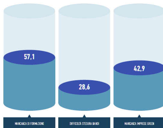
Criticità applicative del GPP nei Comuni metropolitani (anno 2022, in %)

Un secondo ambito di indagine ha riguardato invece i principali benefici che la Pubblica amministrazione ha riscontrato con riferimento al GPP. In questo caso si è analizzata la percezione delle Amministrazione in relazione alle conseguenze positive che l'adozione del GPP può portare sia a livello di organizzazione – nella forma di efficienza e risparmio delle risorse, ma